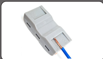
Длина зачистки проводника 10–11 мм